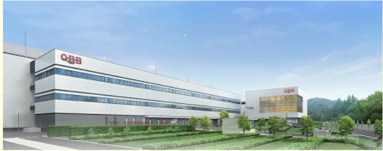
六甲バター株式会社様 神戸工場外観