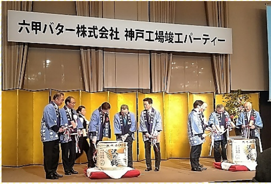
H31.4.25 六甲バター株式会社様 神戸工場竣工パーティー